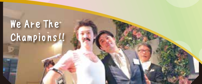
イベントリーダーのご挨拶！