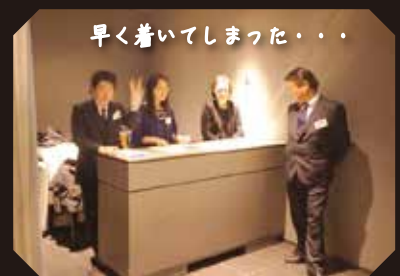
早く着いてしまった・・・