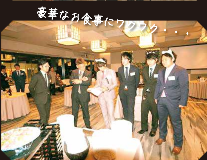
豪華なお食事にワクワク・・・